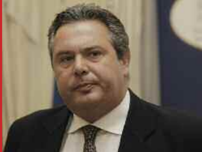
Οι κοριοί της ΕΥΠ την ίδια περίοδο είχαν καταγράψει διάφορες τηλεφωνικές επικοινωνίες του Πάνου Καμμένου με Γάλλους και Ισραηλινούς

Οι Αμερικανοί ήθελαν όλες τις πληροφορίες που καταγράφονταν από τα μηχανήματα γεωγραφικού προσδιορισμού, τα BEACON, που τοποθετούνταν σε αυτοκίνητα, μοτοσικλέτες, σκάφη κ.λπ., αλλά και τις οπτικοακουστικές καταγραφές από μηχανήματα σε μπαρ αναρχικών!