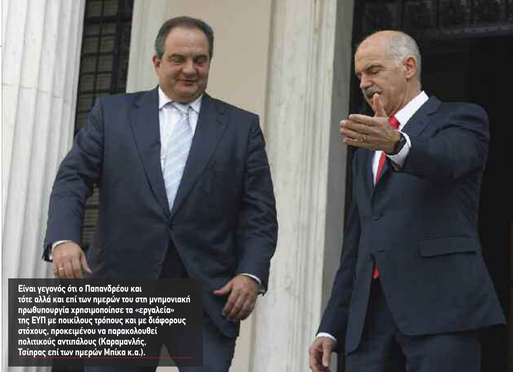
Είναι γεγονός ότι ο Παπανδρέου και τότε αλλά και επί των ημερών του στη μνημονιακή πρωθυπουργία χρησιμοποίησε τα «εργαλεία» της ΕΥΠ με ποικίλους τρόπους και με διάφορους στόχους, προκειμένου να παρακολουθεί πολιτικούς αντιπάλους (Καραμανλής, Τσίπρας επί των ημερών Μπίκα κ.α.).

Η κ. Λεβογιάννη από το 1979 που διορίστηκε μέχρι σήμερα είχε υπηρετήσει στο ιδιαίτερο γραφείο του Ανδρέα Παπανδρέου, στα γραφεία των αρχηγών της ΚΥΠ-ΕΥΠ, Πολίτη και Τσίμα, όπως επίσης υπηρέτησε ως ιδιαίτερα όλων των διευθυντών του